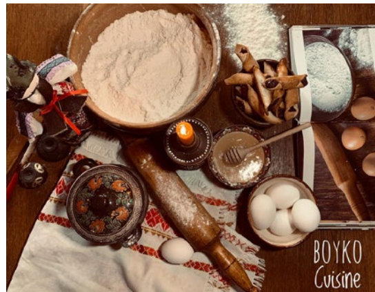
fol. Solomiya Horbatso

Projekt „Przywrócenie i zachowanie tradycji kulinarnych w celu promowania dziedzictwa kulturalnego górskich regionów przygranicznych”, realizowany przez Lokalną Organizację