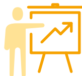
Szkolenia na temat FE