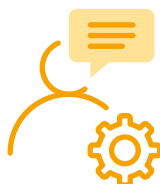
Konsultacje na etapie realizacji projektu