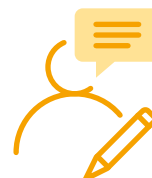
Konsultacje na etapie przygotowania wniosku