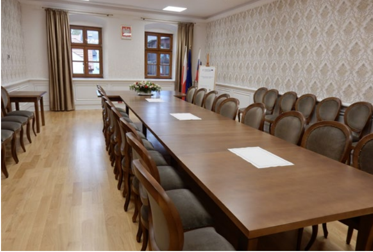
fot. Urząd Miejski w Strumieniu

Gmina Strumień jest przykładem na to, że rozwijanie współpracy transgranicznej przynosi wiele korzyści. Z licznymi partnerami z Czech i Słowacji zrealizowała ona projekty dzięki pozyskaniu funduszy zewnętrznych. Jednym z nich było przedsięwzięcie pod nazwą „ Budatín-Strumień: współpraca na pograniczu – etap 2 ”.