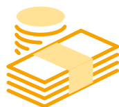
Wskazanie źródeł wsparcia z FE